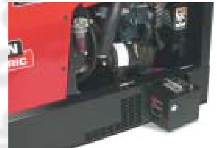
Facile accesso al vano batteria

Ranger 305 D CE Lincoln... pronto per qualsiasi prova.