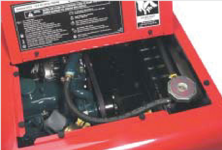
Facile accesso al vano motore

Progettato tenendo in mente la portabilità, il Ranger 305 D CE è costruito utilizzando una robusta struttura che lo rende facilmente trasportabile sia con autocarri muniti di fork lift o gru sia caricandolo su camion.